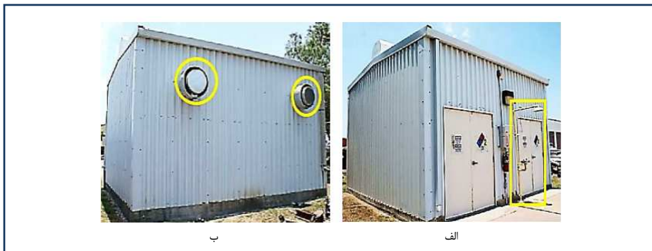
شکل ۱-۱: دوش حمام (الف) و سیستم تهویه (ب) در جایگاه ذخیره سازی موقت