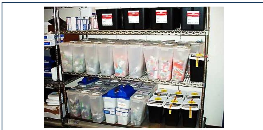
شکل ۱-۱۴: قفسه های مورد استفاده برای ذخیره سازی موقت ظروف حاوی پسماندهای دارویی

از وسایل نقلیه چرخ داری که در مراکز بهداشتی درمانی کوچک (۳۰-۱۰ تخت) در کشور تایلند استفاده می شود روش دیگری برای حمل و نقل پسماندهای تولیدی در این مراکز به حساب می آید که نمونه هایی از این ظروف در شکل آورده شده است [۱۶].