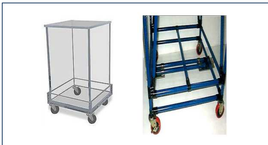
شکل ۱-۷: وسایل مورد نیاز برای انتقال و حمل و نقل پسماند شیمیایی درون سایت

پسماندهای شیمیایی تولید شده باید ذخیره و از نقطه تولید جمع آوری شوند. بعضی اوقات ممکن است نیاز باشد پسماندهای شیمیایی از یک نقطه به نقطه ای دیگر و یا جایگاه ذخیره سازی موقت پسماند منتقل شوند. برای حمل و نقل راحت تر این نوع پسماندها باید از وسایل چرخ داری که برای نمونه در شکل ۱-۷ آورده شده است استفاده کرد. لازم به ذکر است تا حد امکان وسایل مورد استفاده در حمل و نقل باید اختصاصی باشند و وسایل مختلف برای هر نوع پسماند در نظر گرفته شود [۹].