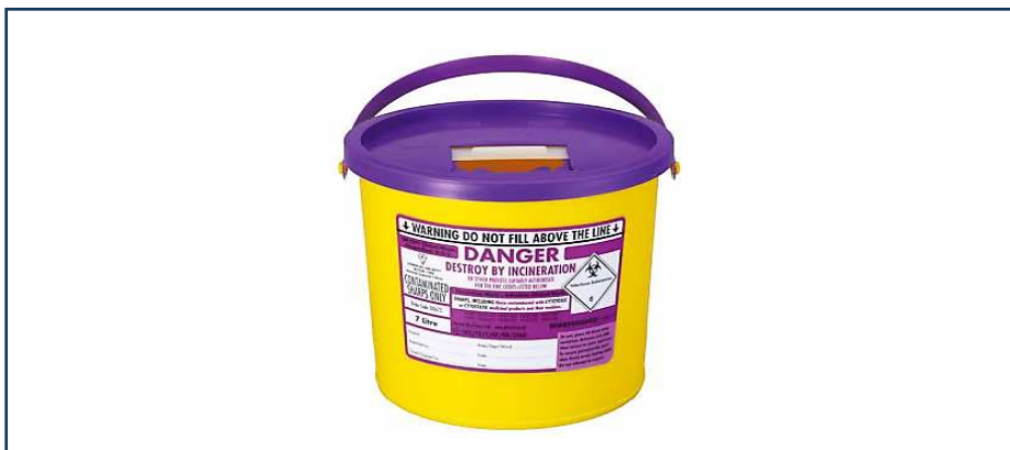
شکل ۱-۱۱: ظرف مورد استفاده برای ذخیره سازی پسماندهای نوک تیز آلوده شده توسط پسماندهای دارویی سایتوتوکسیک و سایتواستاتیک

Animal EWC Code = 18 02 07 → کد مربوط به استفاده های حیوانی