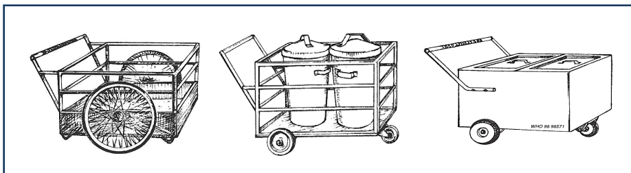
شکل ۱-۱۵: نمونه ای از وسایل چرخ دار مورد استفاده برای مراکز بهداشتی درمانی کوچک

افراد درگیر در امر جمع آوری پسماندهای دارویی باید تمام اصول ایمنی ذکر شده در زیر را به صورت شکل ۱-۱۶، رعایت کنند [۱۶]: