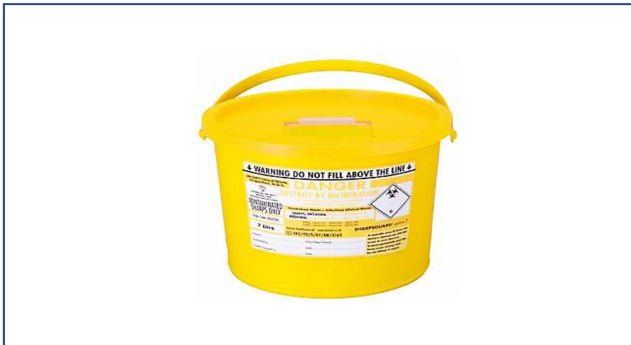
شکل ۱-۱۲: اشیاء یا پسماندهای نوک تیز آلوده شده توسط پسماندهای دارویی غیرسایتوتوکسیک و غیرسایتواستاتیک

Animal EWC Code = 18 02 03 → کد مربوط به استفاده های حیوانی