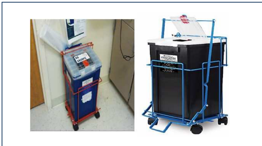
شکل ۱-۱۳: وسایل چرخ دار مورد استفاده برای حمل و نقل و انتقال درون سایت ظروف حاوی پسماند دارویی