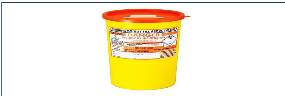
شکل ۱-۱۰: ظرف مورد استفاده برای ذخیره سازی پسماندهای نوک تیز آلوده نشده با پسماندهای دارویی