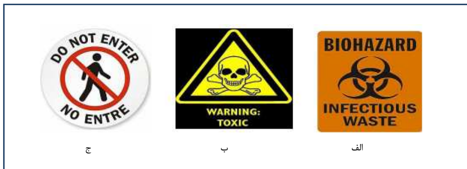
شکل ۱-۲: علائم و نشانه های مخصوص مورد استفاده برای جایگاه ذخیره سازی موقت

ظروفی که برای ذخیره سازی پسماندهای شیمیایی مورد استفاده قرار می گیرند باید دارای شرایط زیر باشد: