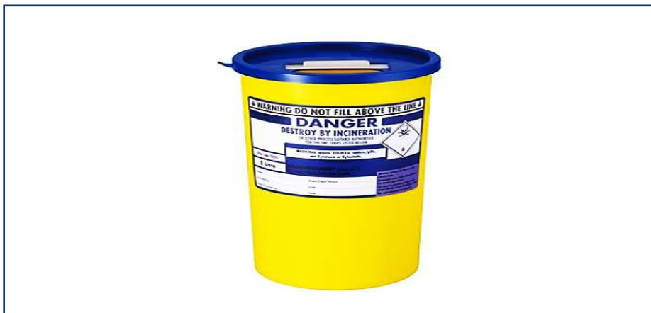
شکل ۱-۹: ظرف مورد استفاده برای ذخیره سازی داروهای غیرسایتوتوکسیک و غیرسایتواستاتیک

برای ذخیره سازی و نگهداری پسماندهای دارویی خطرناک، شرکت Stericycle کانتینرهایی را تحت عنوان کانتینرهای پسماند دارویی بمیس و کندال در حجم های مختلف و به صورت زیر پیشنهاد کرده است [۲۲]: