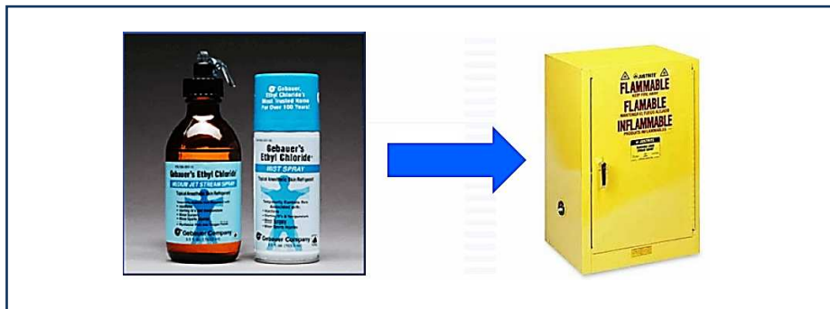
شکل ۱-۶: روش ذخیره سازی مواد قابل اشتعال