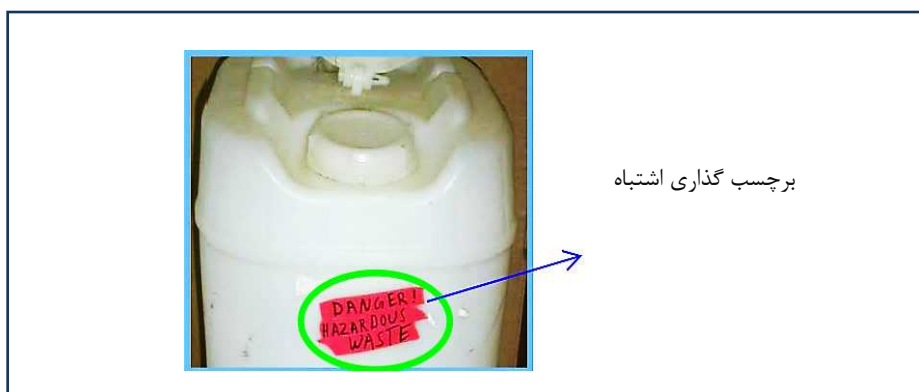
شکل ۱-۴: روش اشتباه برچسب گذاری