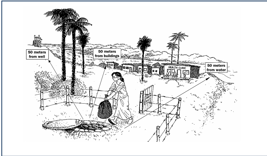
شکل ۱-۱۷: دفن مطمئن در محل بیمارستان

شدن آب ناشی از باران جلوگیری بعمل آید. اگر خاک به میزان کافی در دسترس نباشد می توان از آهک برای پوشیدن سطح پسماند استفاده کرد. در مواردی که عفونت های خاص (ناشی از ویروس ابولا (Ebola virus)) شایع شده باشد باید از خاک و آهک به طور همزمان به عنوان لایه پوششی پسماندها استفاده کرد. لازم به ذکر است باید دسترسی به گودال های دفن پسماند در محل بیمارستان توسط حصار یا دیواری محدود شود و فقط توسط پرسنل مسئول دفن پسماند قابل دسترسی باشد و همچنین حداقل فاصله این محل تا منابع آب و ساختمان های اطراف ۵۰ متر باشد و جهت شیب آن به صورتی باشد که به سمت منابع آب زیرزمینی و سطحی نباشد. شکل ۱-۱۷ نشان دهنده دفن مطمئن در محل بیمارستان است.