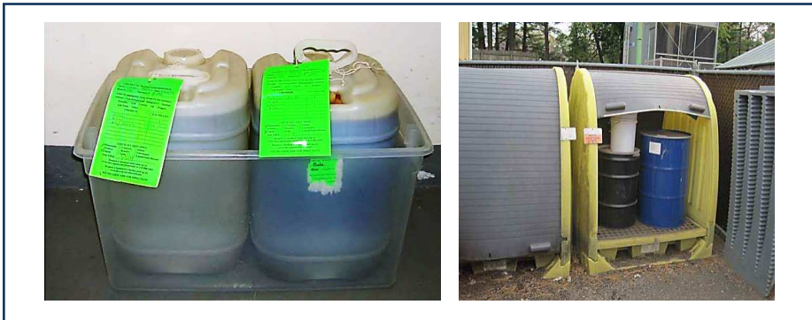
شکل ۱-۵: روش صحیح نگهداری موقت ظروف حاوی مواد شیمیایی

۶) بعد از برچسب گذاری باید ظروف حاوی پسماندهای شیمیایی بصورتی نگهداری شوند که خطر واژگونی و ریختن این پسماندها وجود نداشته باشد، به همین علت باید از ظروفی که در شکل ۱-۵ آورده شده است استفاده کرد.